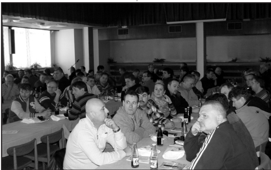
▲ Pohled do sálu Kulturního domu s delegáty odborové konference na Dole ČSM...

Celá konference pak byla ukončena schválením usnesení. red