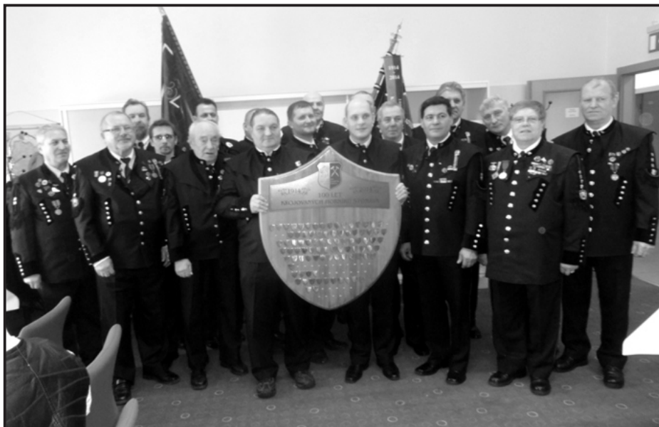
▲ Snímek z výroční schůze Spolku krojovaných horníků ze Stonavy...