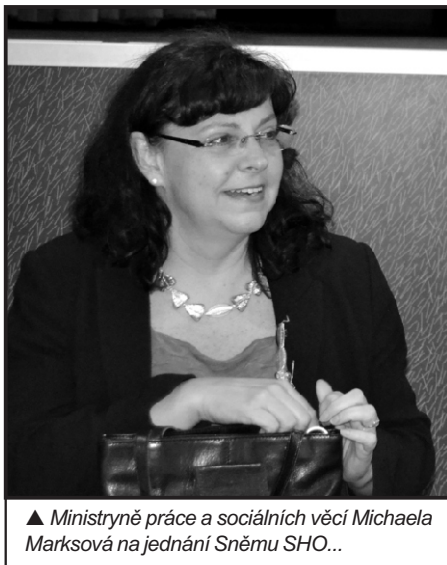
▲ Ministryně práce a sociálních věcí Michaela Marksová na jednání Sněmu SHO...