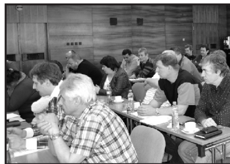
▲ Snímek z jednání Rady SHO...

nicích. Ta není nikde jednoduchá. Hornictví prožívá velmi těžké období a ocitá se neprávem na okraji zájmu. Bylo zmíněno, že někteří politici jsou hlouzí k varování ze strany odborových organizací. Paradoxem pak je, že regiony, ve kterých je těžba uhlí hlavním zaměstnavatelem, patří mezi kraje s nejvyšší nezaměstnaností. Postupným útlumem hrozí nastat situace, kdy nezaměstnanost převyší přípustnou hranici. Z fóra sněmu zazněly názory, že politici by si měli uvědomit dopady svých, podle odborů, často špatných rozhodnutí. Vždyť uhlí, jak černé nebo hnědé, je stále významnou